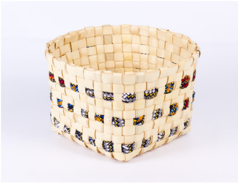
Eiyeu Amanchi PM: