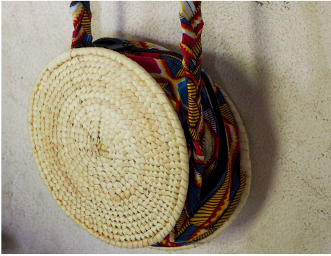
Sac rond wax: