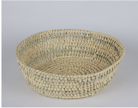
Tressé avec noeuds: